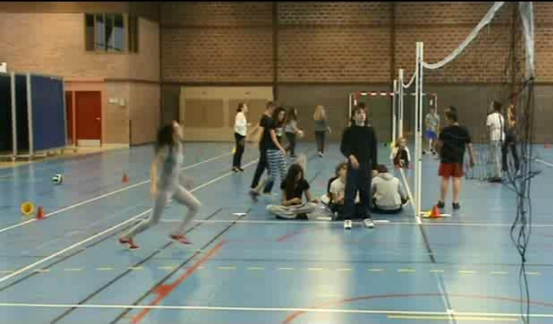
Kty Patinet- forum EPS académie d'Amiens 12 décembre 2013